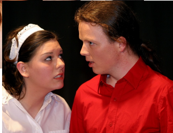
ABBILDUNG 2-2: THEATERSTÜCK "DER EINGEBILDETE KRANKE", ABBILDUNG 3: BOHÈME SAUVAGE