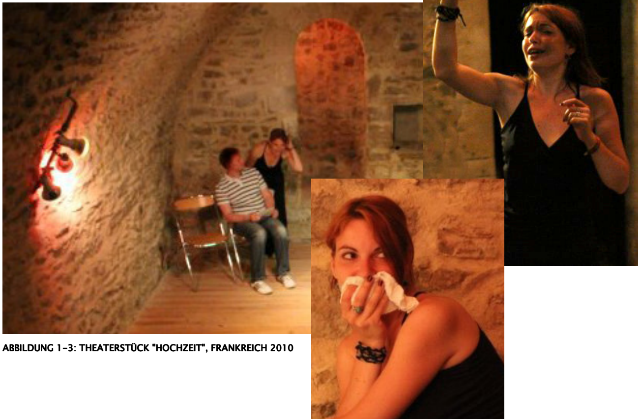
ABBILDUNG 1–3: THEATERSTÜCK "HOCHZEIT", FRANKREICH 2010

studentischen Filmprojekten vor und hinter der Kamera. Im interkulturellen Kontext führte es sie zu Workshops nach Italien und Österreich, wo sie an weiteren medialen Projekten mitarbeitete. Mit dem Umzug nach Hamburg 2007 eröffneten sich neue Wege im Theaterbereich, wo sie sich der Hochschulgruppe „Improvisationstheater kostenlos“ anschloss. Mit dieser hatte sie mehrere Auftritte in Hamburg, leitete einzelne Projektgruppen und führte Seminare durch. 2008 nahm sie am Theaterworkshop in Frankreich teil, dessen Abschluss ein französisch-deutsches Stück vor Publikum bildete. 2011 gründete sie gemeinsam mit Ole Meinderink, Maria Borchardt, Andrea Schomburg die Theatergruppe Freigeister.